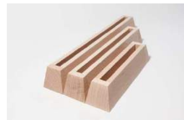
ohne LED-Band und Buchse 8 oder 10 mm Nut