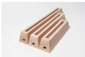
mit LED-Band und Hohlbuchse 8 mm Nut