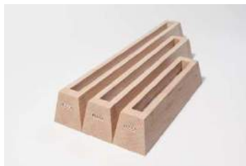
mit LED-Band RGB und RGB-Buchse 10 mm Nut